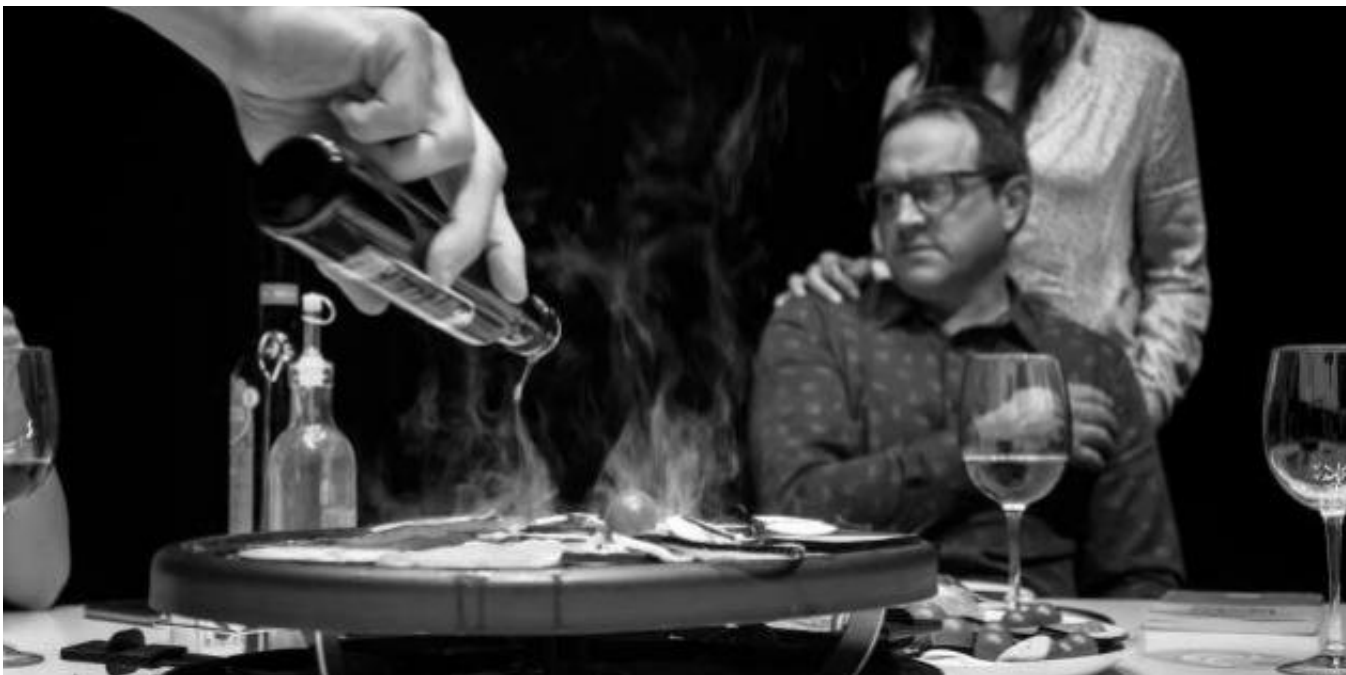
Unha das esceas de 'Raclette'. AEP

Lunes 7 de Marzo de 2016 | Camilo Franco